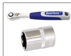
PIPER & SKRALLER BONDTOOLS