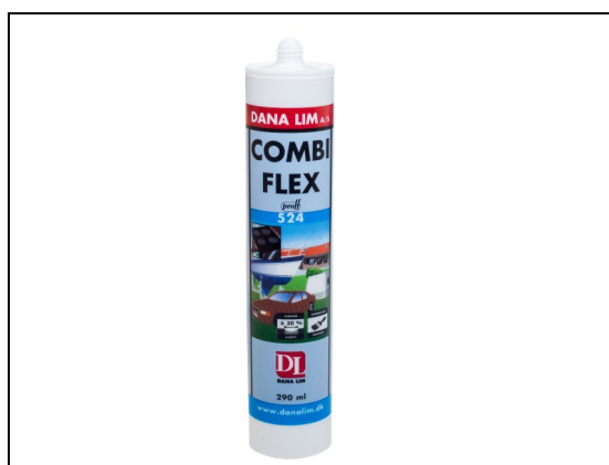
FUGE & LIM DANA