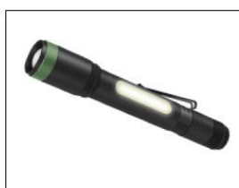
TO LYSKILER OG MAGNET