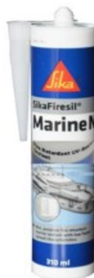
SIKA FIRESIL MARINE